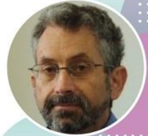
Dr. Jaime Amsel Conferenciante de Transformación Organizacional a la Innovación

Diciembre 9, 2020 5:00 PM (Hora de Israel) 9:00 AM (Hora de Mexico)